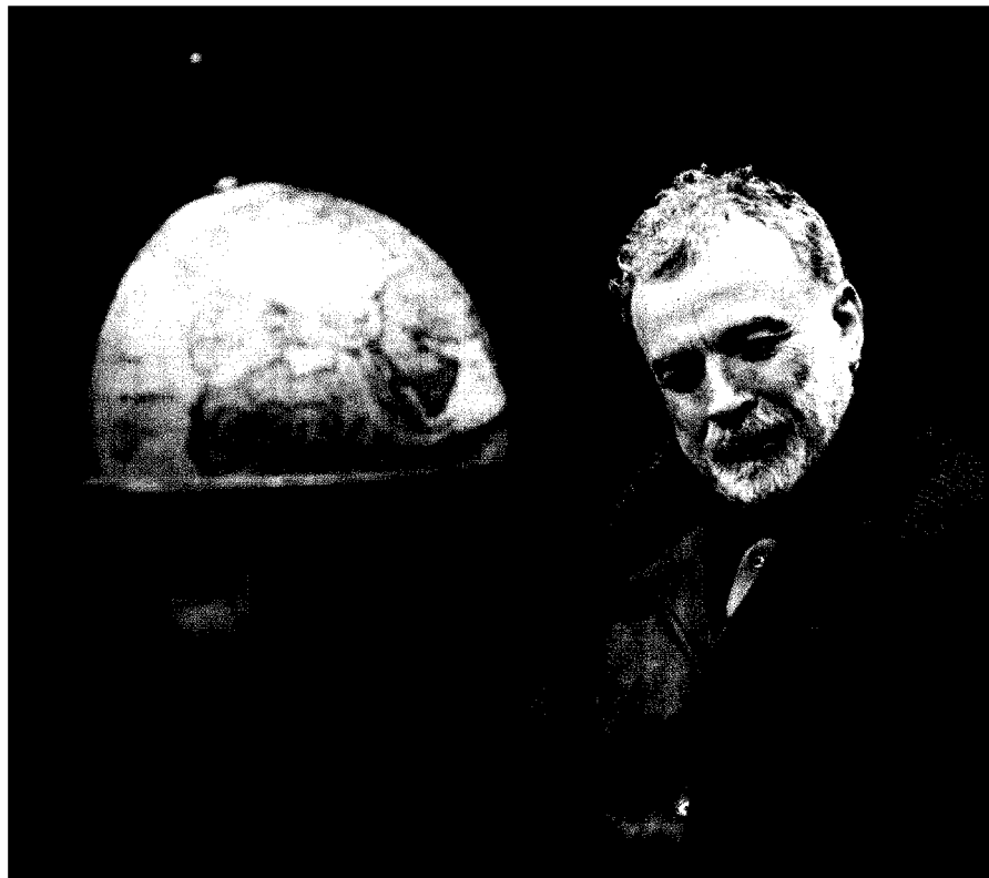
In alto e in basso, l'attore Franco Branciaroli