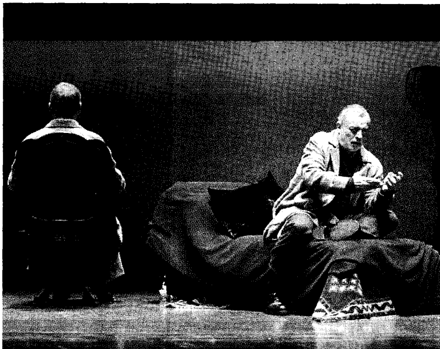
Una scena di "Edipo Re" portato in scena da Franco Branciaroli al Teatro Municipale